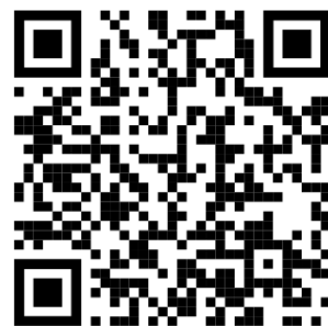
LA RÉPARABILITÉ DES OBJETS